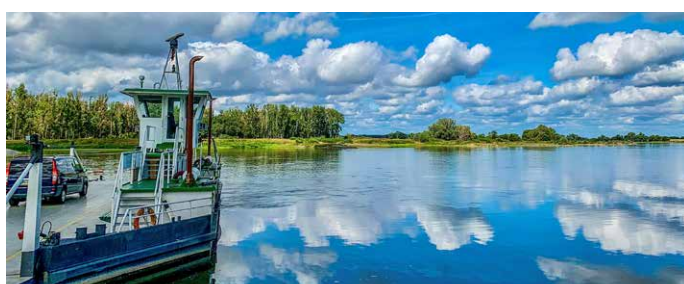
Elbauen beim Havelberg