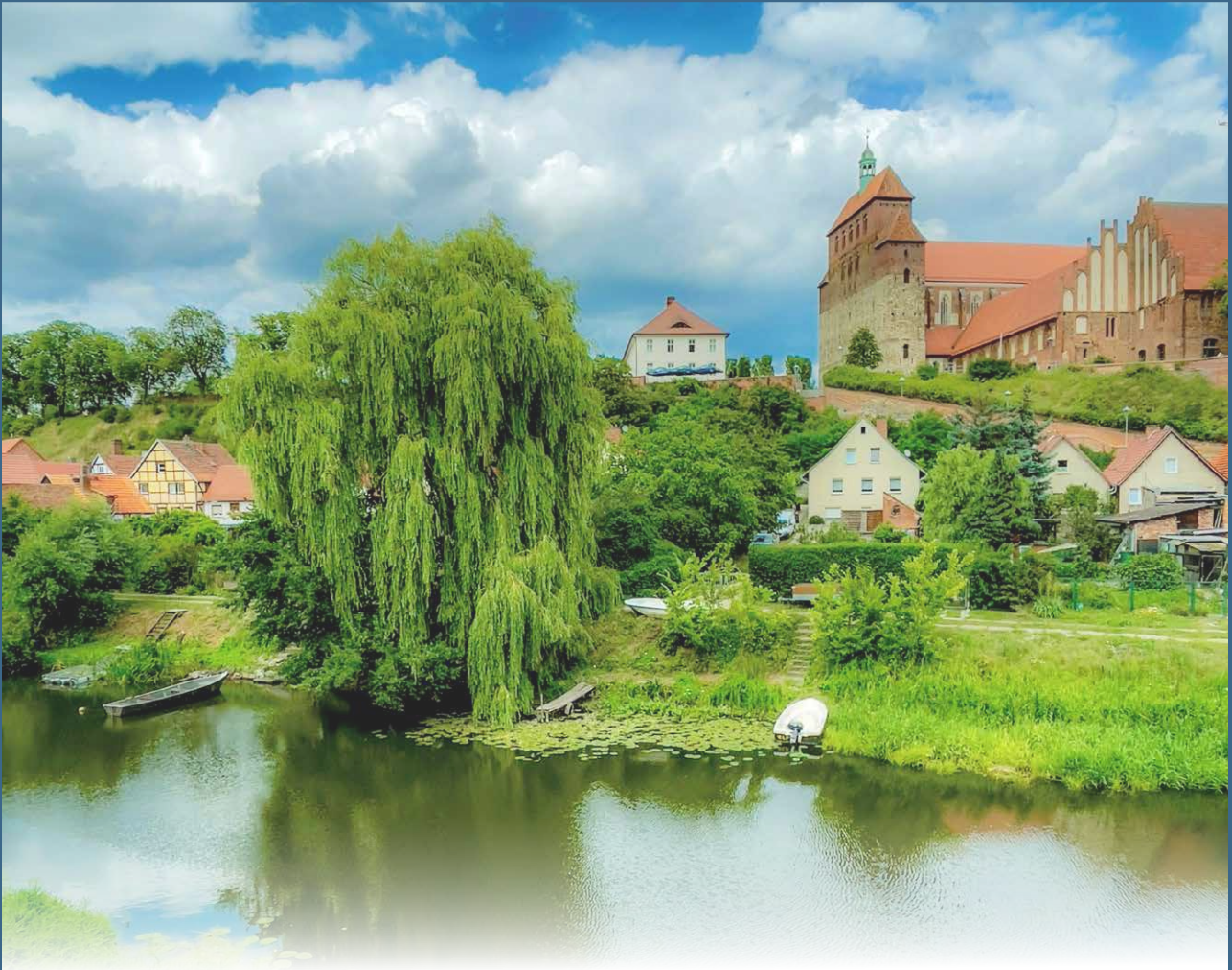
Havelberg mit Dom