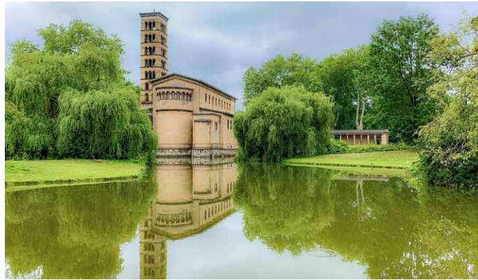
Friedenskirche im Schlosspark Sanssouci