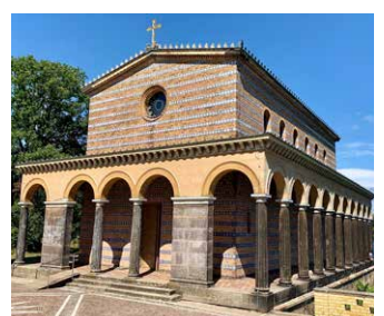
Heilandskirche am See, Sacrow