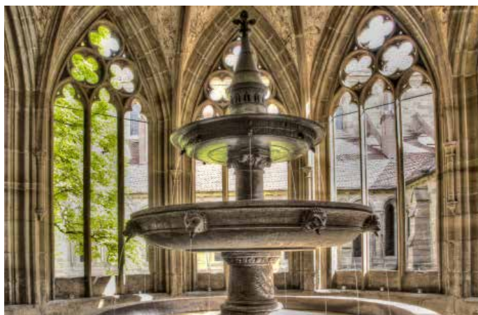
Im Kloster Maulbronn