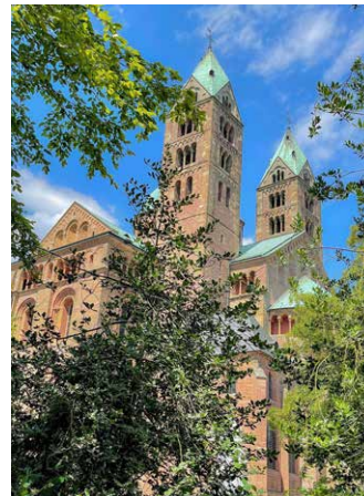
Dom in Speyer

Zwischen Schwarzwald und Elsass wirkte im Mittelalter ein wahrhaft schöpferischer Geist: Baukunst der Romanik in Schaffhausen, Alpirsbach und Speyer, gotische Skulptur von Weltrang in Strassburg sowie die farbensprühende Bildkunst einer neuen Zeit in Colmar, mit Werken von Erwin Steinbach, Niklaus Gerhaert von Leyden und Matthias Grünewald. Zur kunsthistorischen Fülle der Reise gesellen sich erbauliche Landschaftserlebnisse und kulinarische Freuden im spätsommerlichen Ambiente von Baden-Baden.