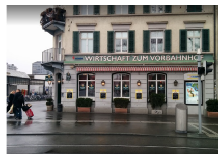
Wirtschaft zum Vorbahnhof 2017