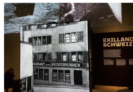
Spiegelgasse 14 in Zürich, 1917*